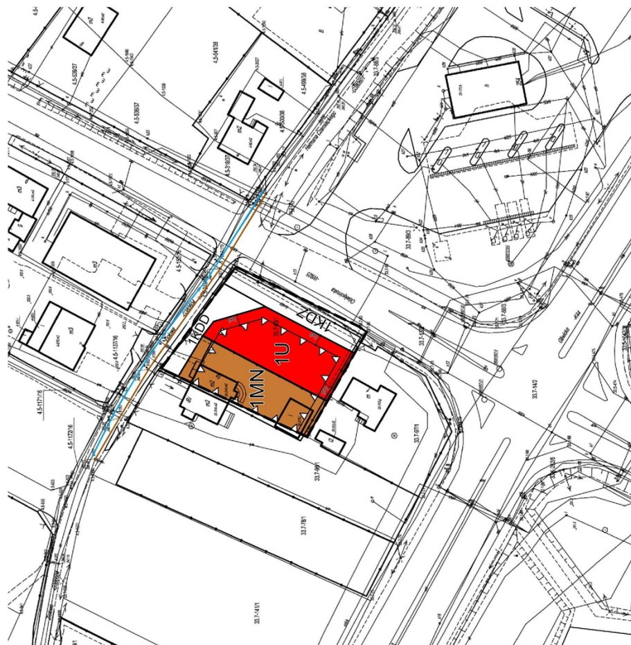
WYRYS ZE STUDIUM UWARUNKOWAŃ I KIERUNKÓW ZAGOSPODAROWANIA PRZESTRZENNEGO MIASTA MIKOŁOWA SKALA 1 : 5 000