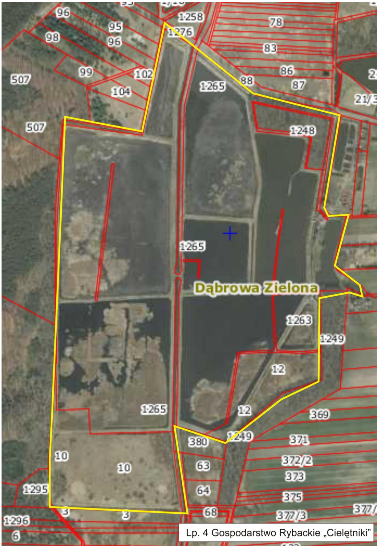
Lp. 4 Gospodarstwo Rybackie „Cieleńniki”