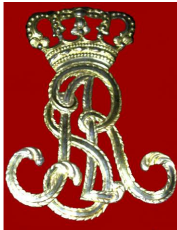
Monogram Stanisława Augusta Poniatowskiego

Ogniwo drugie to okrągły medalion z błękitnym kołem, na którym umieszczono złoty, ukoronowany monogram SAR – Stanislaus Augustus Rex, króla Stanisława Augusta Poniatowskiego. Ma to upamiętnić fakt, że ostatnim właścicielem miasta był polski rząd oraz, że Stanisław August nadał miastu obecny herb.