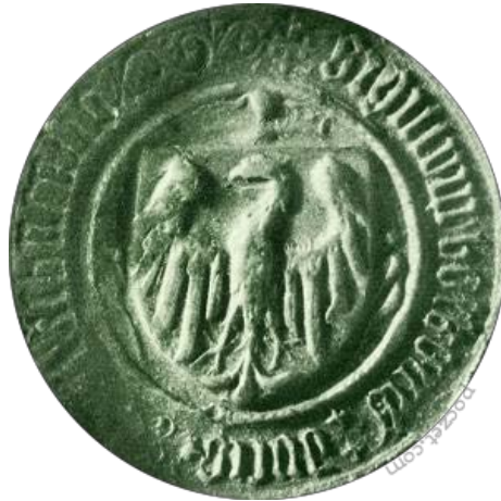
Pieczęć Bolesława I cieszyńskiego

Łańcuchy władzy Czeladzi składają się z dwudziestu trzech ogniów. Ogniwo pierwsze to okrągły medalion z błękitnym kołem, na którym znajduje się złoty górnośląski orzeł. Ma to symbolizować fakt, że do 1443 roku właścicielami Czeladzi byli książęta śląscy z linii opolskiej, bytomskiej i cieszyńskiej. Konkretna stylizacja orła została zaczerpnięta z pieczęci księcia Bolesława I cieszyńskiego, za którego rządów Czeladź po raz pierwszy wymieniono w źródłach jako miasto. Orzeł zwrócony jest w ukłonie heraldycznym do wewnątrz łańcucha.