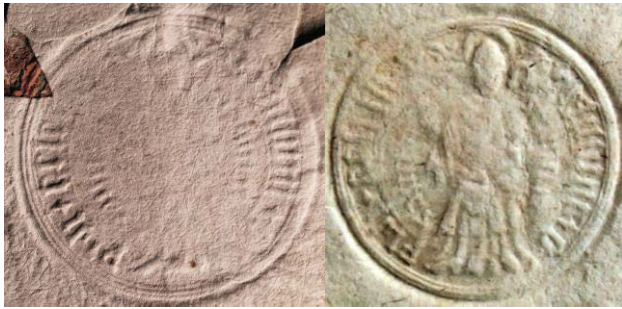
Odciski pierwszej pieczęci miejskiej Czeladzi

Pierwsze dwa rzędy AKKK, Libri Archivi, XI Transactiones, karty 11-14, 20, 94, 233, 286, lata 1501-1516 Rząd trzeci, zdjęcie pierwsze: AGAD ASK XLVI – Lustracje, rewizje i inwentarze dóbr królewskich, Przywileje dla dóbr biskupstwa krakowskiego nadane od r. 1498 k. 211, sygn 1/7/09/62a k. 211, rok 1786 („Dezyderia miasteczka Czeladzi”).