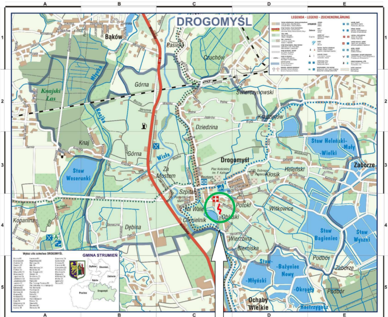
Orientacyjna lokalizacja ulicy Cisowej