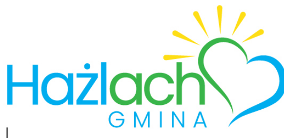
wersja główna znaku