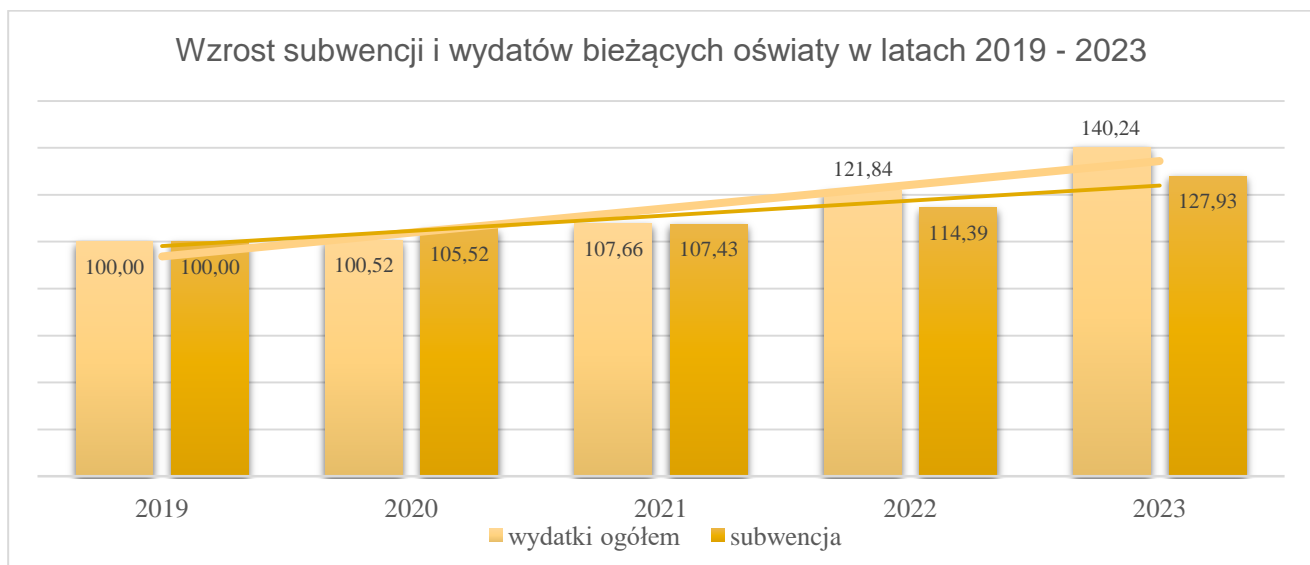
Wzrost subwencji i wydatków bieżących oświaty w latach 2019 - 2023