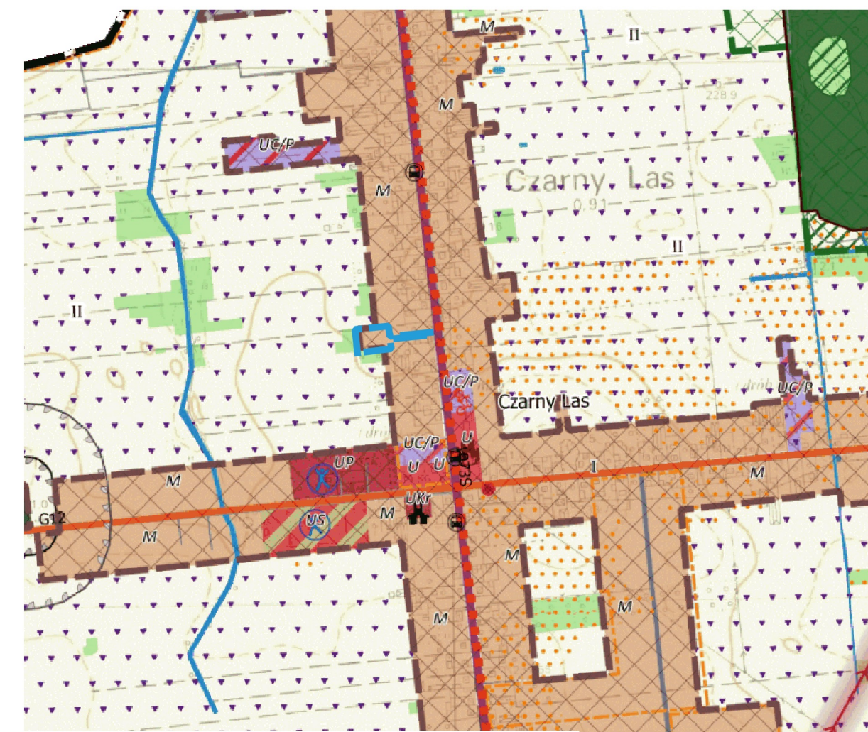
Wyrys ze Studium uwarunkowań i kierunków zagospodarowania przestrzennego Gminy Mykanów, uchwalonego uchwałą nr 411/LIII/2023 Rady Gminy Mykanów z dnia 2 czerwca 2023 r.

Obszary objęte planem znajdują się w całości w granicach udokumentowanego Głównego Zbiornika Wód Podziemnych nr 326 "Częstochowa E"