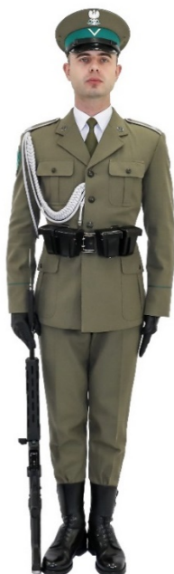
Zdjęcie nr 12. Funkcjonariusz z karabinkiem w postawie zasadniczej