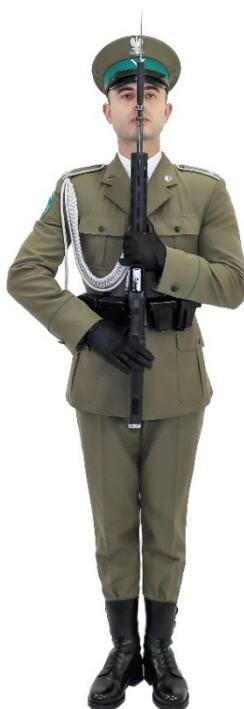
Zdjęcie nr 14. Funkcjonariusz z bronią w chwycie „Prezentuj broń”