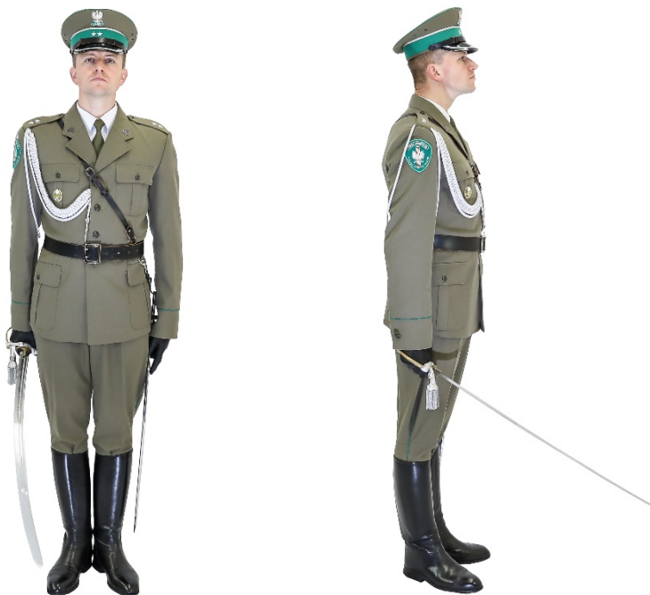
Zdjęcie nr 1. Funkcjonariusz z szablą w postawie zasadniczej