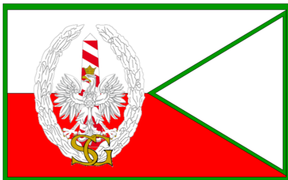
Proporzec Komendanta Dywizjonu Straży Granicznej