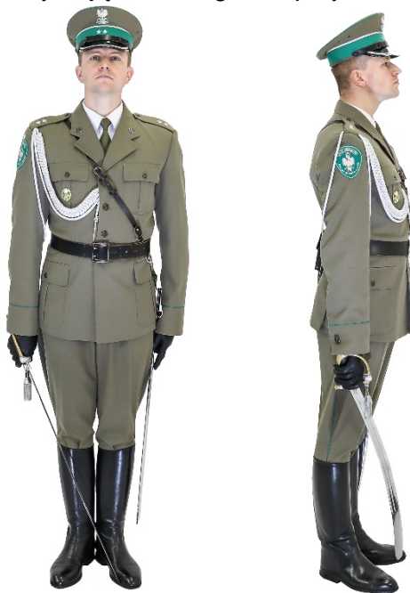
Zdjęcie nr 2. Funkcjonariusz z szablą w postawie swobodnej