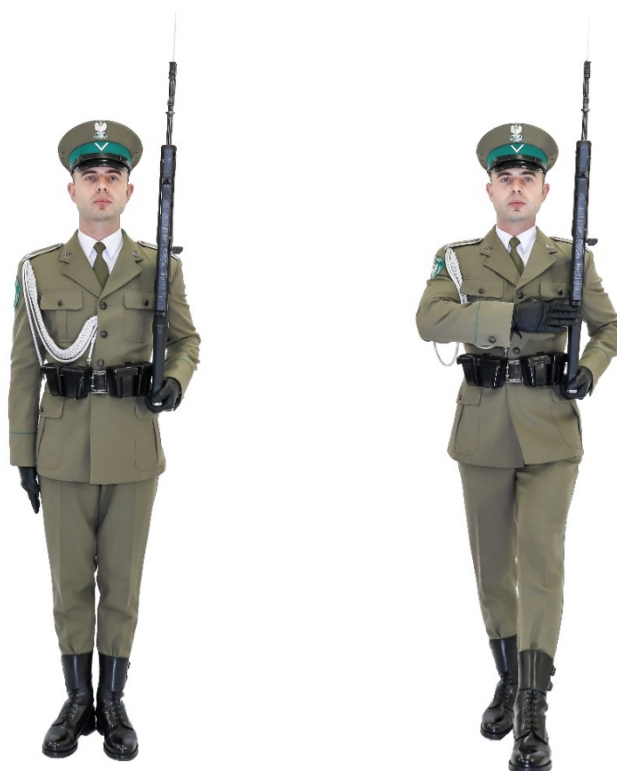
Zdjęcie nr 13. Funkcjonariusz z bronią w chwycie „Na ramię broń” w postawie zasadniczej i w marszu