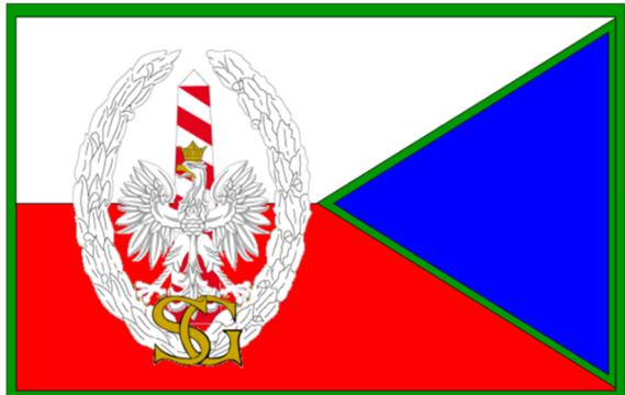
Proporzec Komendanta Morskiego Oddziału Straży Granicznej i jego zastępców