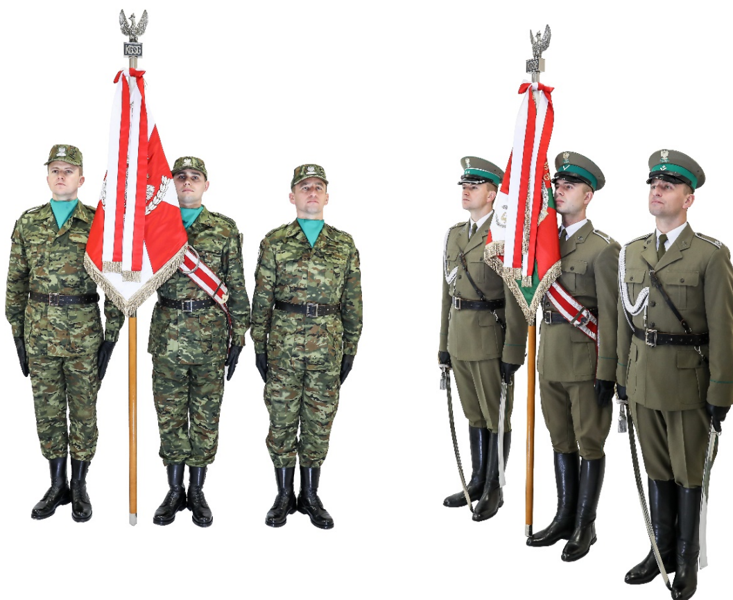
Zdjęcie nr 5. Poczet sztandarowy z szablami i bez szabel w postawie swobodnej