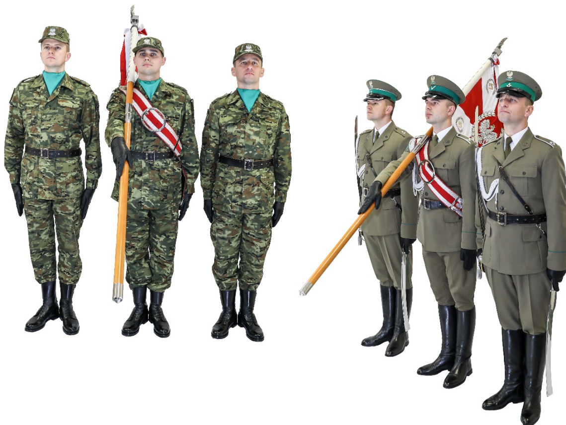
Zdjęcie nr 9. Poczty sztandarowe z szablami i bez szabel w położeniu sztandaru „Na ramię”

12) chwyt sztandarem „ Na ramię ” (zdjęcie nr 9) sztandarowy wykonuje z położenia „ Prezentuj ” po zapowiedzi komendy do marszu („ Za mną ” lub „ Na wprost ”). Wykonując chwyt „ Na ramię ”, sztandarowy kładzie drzewiec prawą ręką, pomagając sobie lewą, na prawe ramię, po czym energicznie lewą rękę opuszcza do położenia, jak w postawie zasadniczej. Natomiast prawa ręka zostaje wyprostowana na drzewcu, jednocześnie regulując kąt położenia sztandaru, tak by był on ustawiony pod kątem 45°. Płat sztandaru musi być oddalony od barku na odległość około 30 cm. Dowódca pocztu sztandarowego i asystujący pozostają w postawie zasadniczej. W przypadku pocztu sztandarowego wyposażonego w szable dowódca pocztu sztandarowego wraz z asystującym pozostają w postawie z szablą na prawym ramieniu trzymaną wyprostowaną ręką;