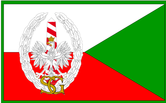
Proporzec Komendanta Głównego Straży Granicznej i jego zastępców