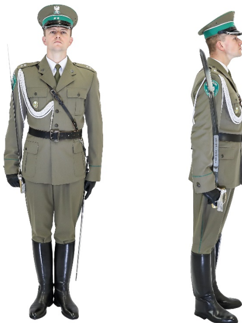
Zdjęcie nr 3. Funkcjonariusz z szablą na ramieniu