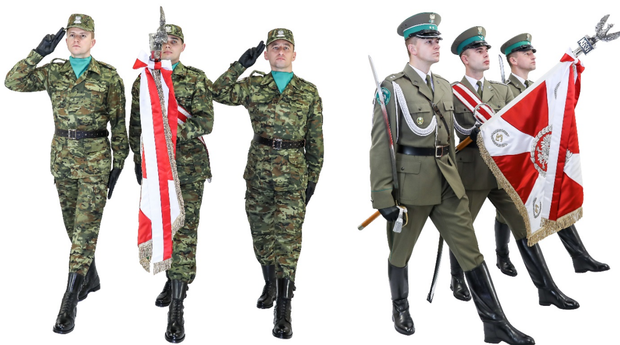
Zdjęcie nr 10. Poczet sztandarowy w marszu z jednoczesnym salutowaniem sztandarem