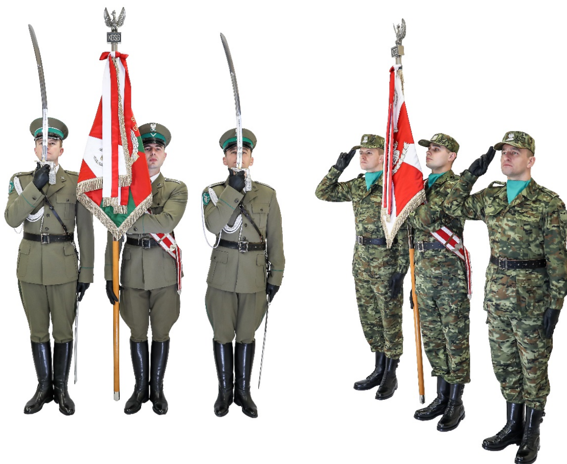
Zdjęcie nr 7. Poczet sztandarowy z szablami i bez szabel w położeniu sztandaru „Prezentuj”