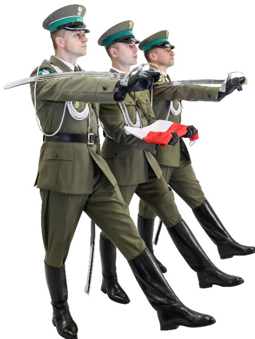
Zdjęcie nr 11. Poczet flagowy w marszu

Następnie funkcjonariusze wykonują czynności związane z przypięciem i podniesieniem flagi określone w przepisach w sprawie regulaminu musztry i sposobu zachowania się funkcjonariuszy Straży Granicznej w czasie pełnienia służby.