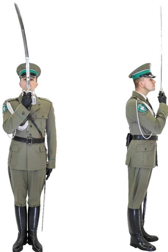
Zdjęcie nr 4. Salutowanie szablą w miejscu