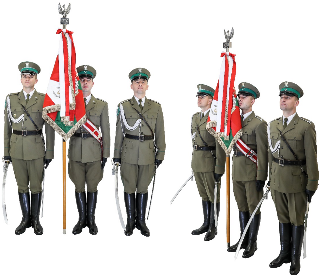
Zdjęcie nr 6. Poczet sztandarowy z szablami w postawie zasadniczej