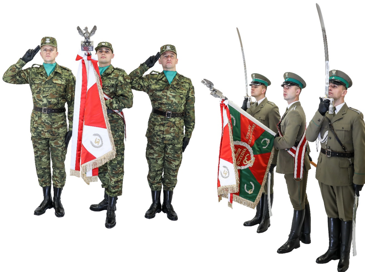
Zdjęcie nr 8. Salutowanie sztandarem w miejscu