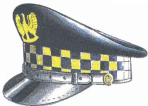
Rys. 1 Czapka służbowa okrągła dla inspektora, specjalisty, strażnika i aplikanta