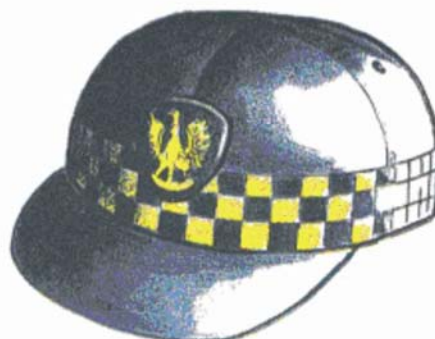
Rys. 5 Czapka typu sportowego