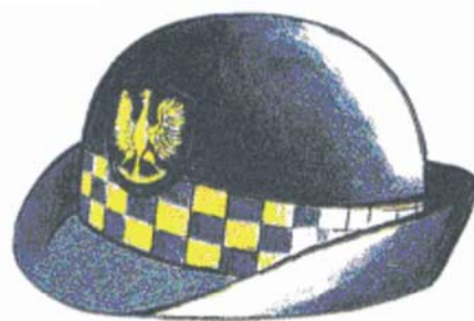
Rys. 4 Kapelusz damski