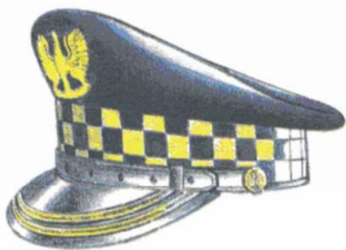
Rys. 3 Czapka służbowa z dwoma galonami dla komendanta i zastępcy komendanta