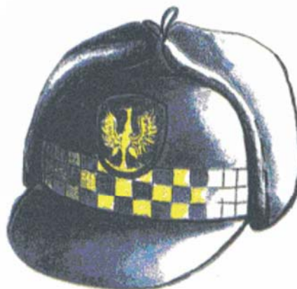
Rys. 6 Uszanka z daszkiem