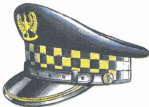
Rys. 2 Czapka służbowa okrągła z jednym galonem dla naczelnika, zastępcy naczelnika, kierownika i zastępcy kierownika