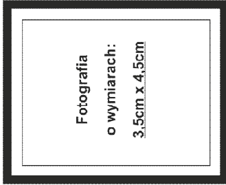
nie wykraczać poza ramkę wewnętrzną