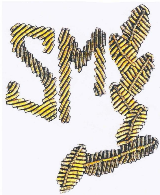
Oznaka strażnika na kołnierzu kurtki