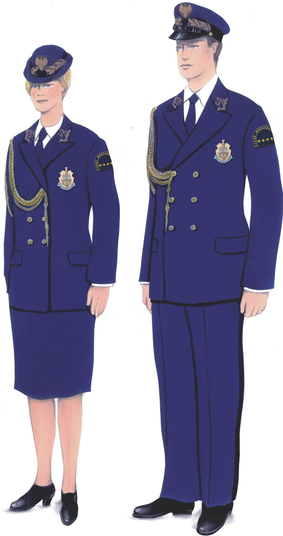
Ubiory galowo-wyściowe ze sznurem galowym