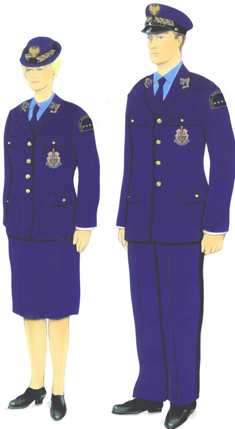
Ubiory służbowe z kurtką służbową