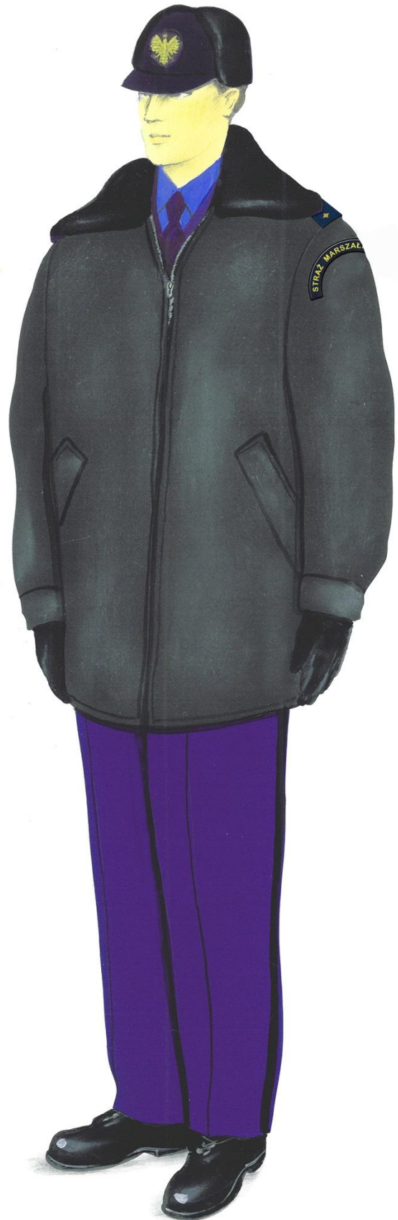
Ubiór służbowy z kurtką 3/4