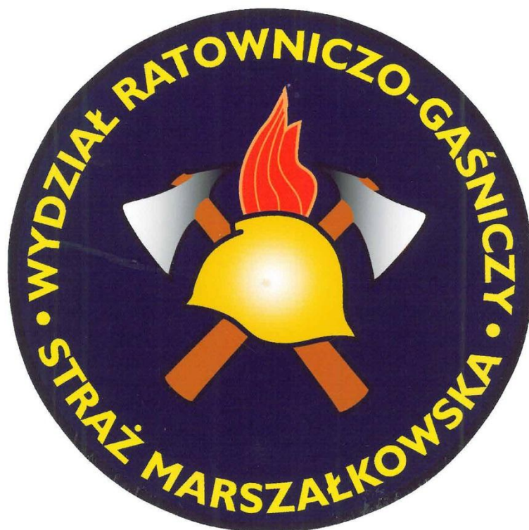
Oznaka ratownika wydziału ratowniczo-gaśniczego