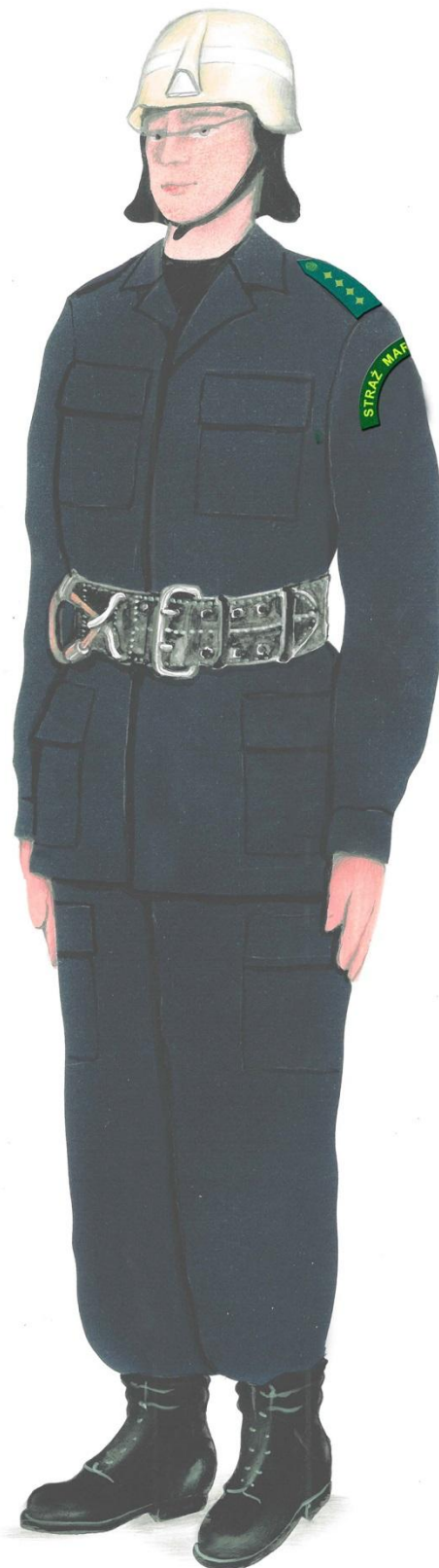
Ubiór specjalny ratownika