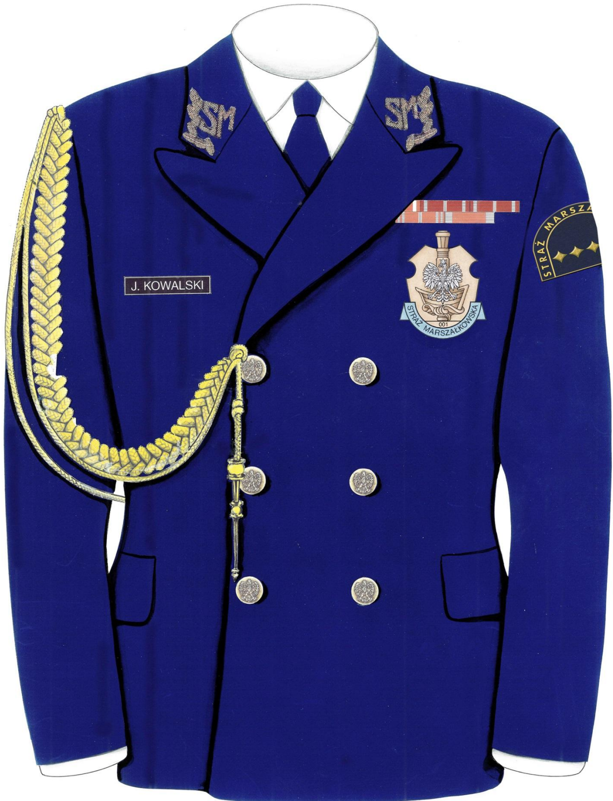
na kurtce ubioru galowo-wyjściowego