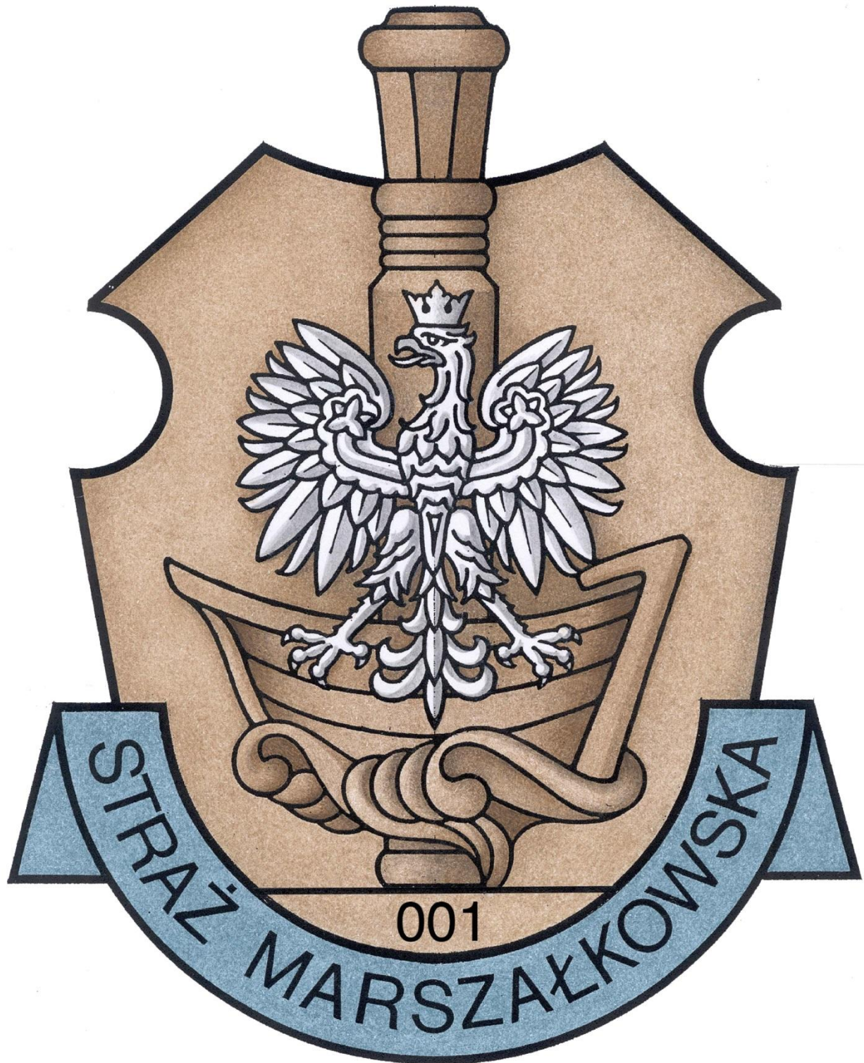
Odznaka identyfikacji indywidualnej