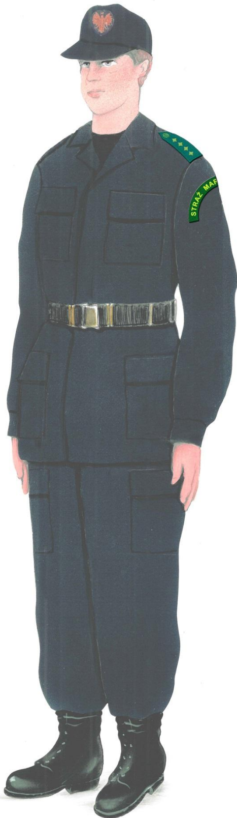
Ubiór specjalny strażnika