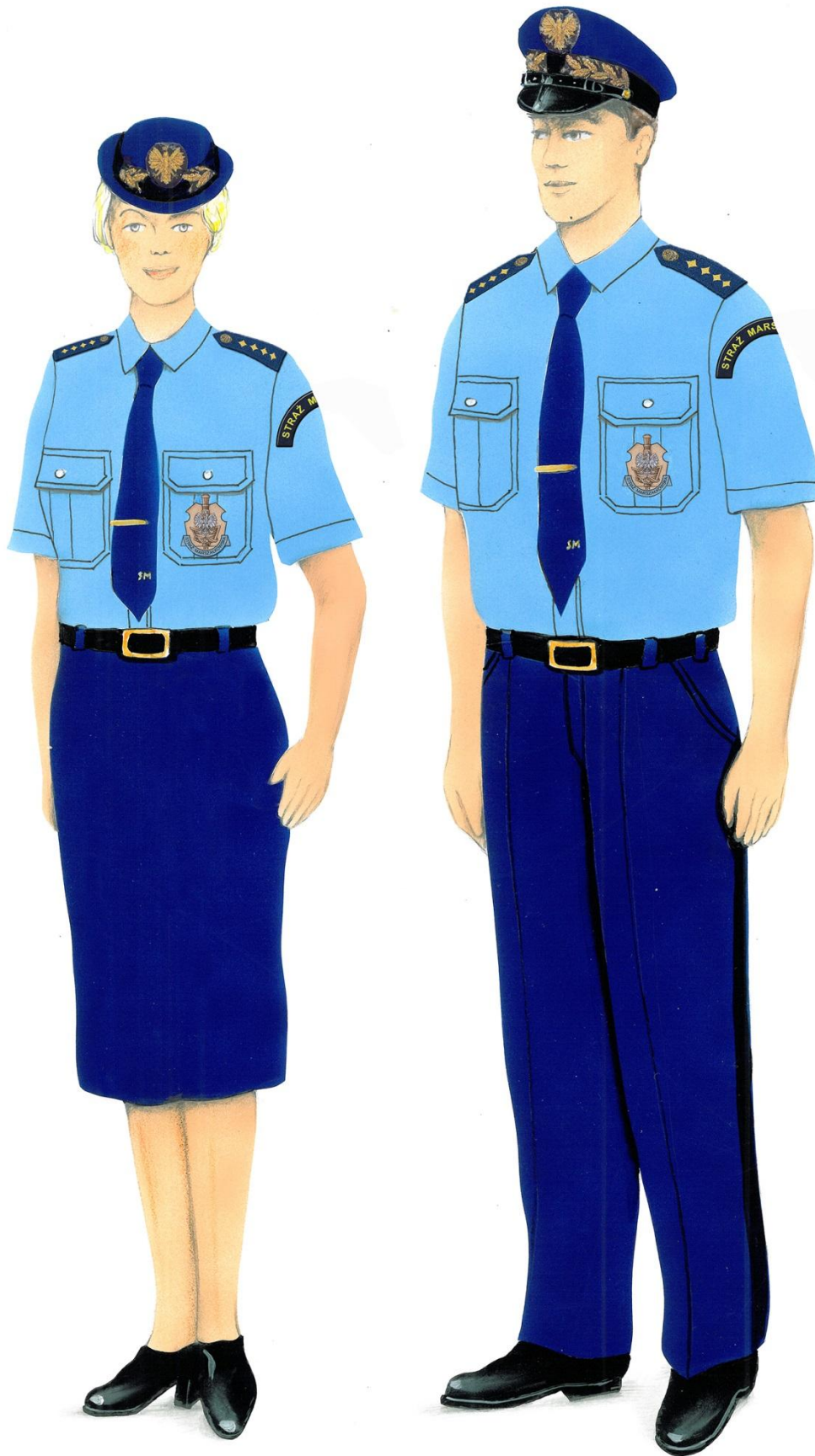
Ubiory służbowe z koszulą z krótkimi rękawami