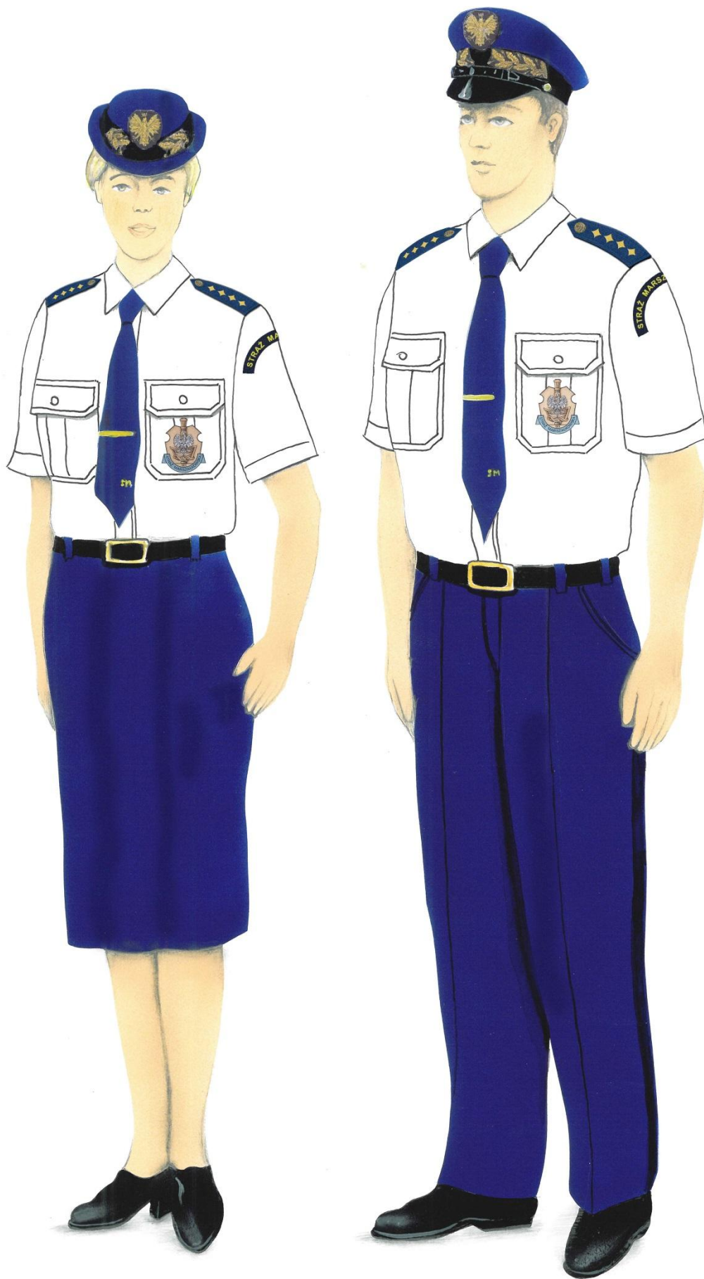
Ubiory galowo-wyjściowe z koszulą z krótkimi rękawami