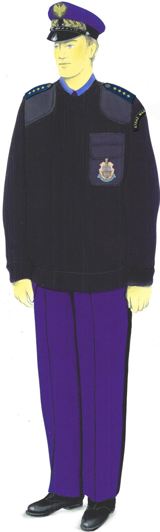
Ubiór służbowy ze swetrem