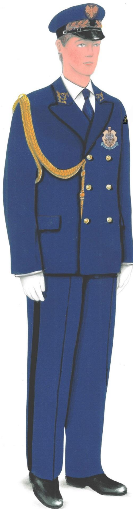
Ubiór galowo-wyjściowy z białymi rękawiczkami