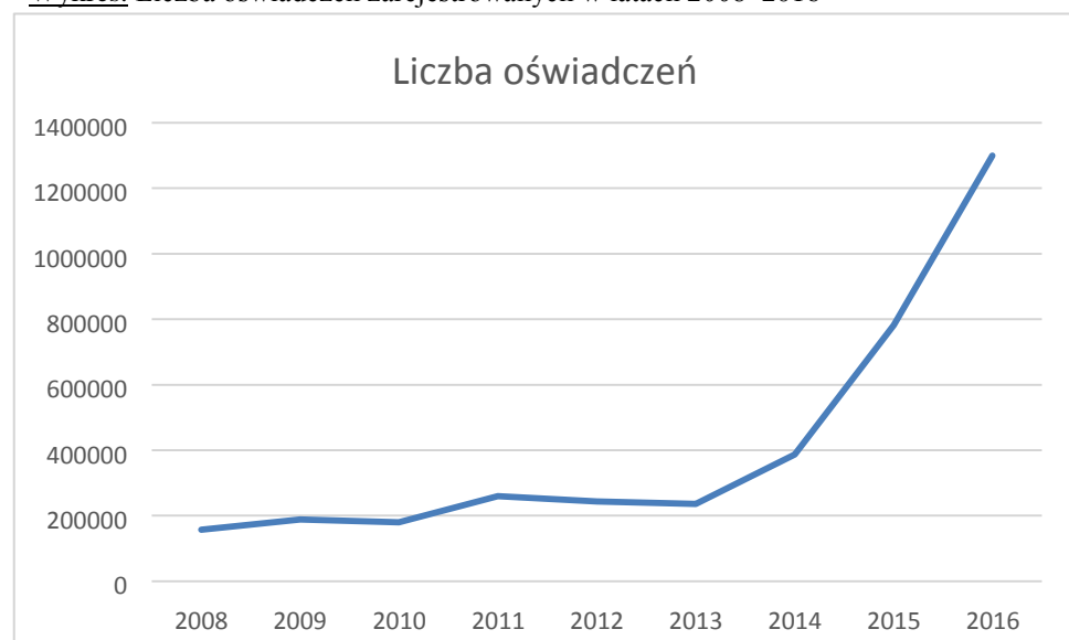
Wykres. Liczba oświadczeń zarejestrowanych w latach 2008–2016

Procedura oświadczeniowa w obecnej formie jest bardzo elastyczna, co do zasady nie przewiduje specjalnych warunków rejestracji oświadczenia (§ 1 pkt 20 rozporządzenia Ministra Pracy i Polityki Społecznej z dnia 21 kwietnia 2015 r. w sprawie przypadków, w których powierzenie wykonywania pracy cudzoziemcowi na terytorium Rzeczypospolitej Polskiej jest dopuszczalne bez konieczności uzyskania zezwolenia na pracę). Należy wskazać na bardzo szybki przyrost rejestrowanych oświadczeń w ostatnich latach, zwłaszcza dla obywateli Ukrainy, dla których rejestruje się ok. 97% oświadczeń. Jednocześnie należy wskazać, że z roku na rok rośnie też przeciętna liczba oświadczeń rejestrowanych dla jednego cudzoziemca. W 2012 r. było to 1,14 oświadczenia, 2013 r. – 1,24, 2014 r. – 1,32, 2015 r. – 1,45, 2016 r. – 1,56.