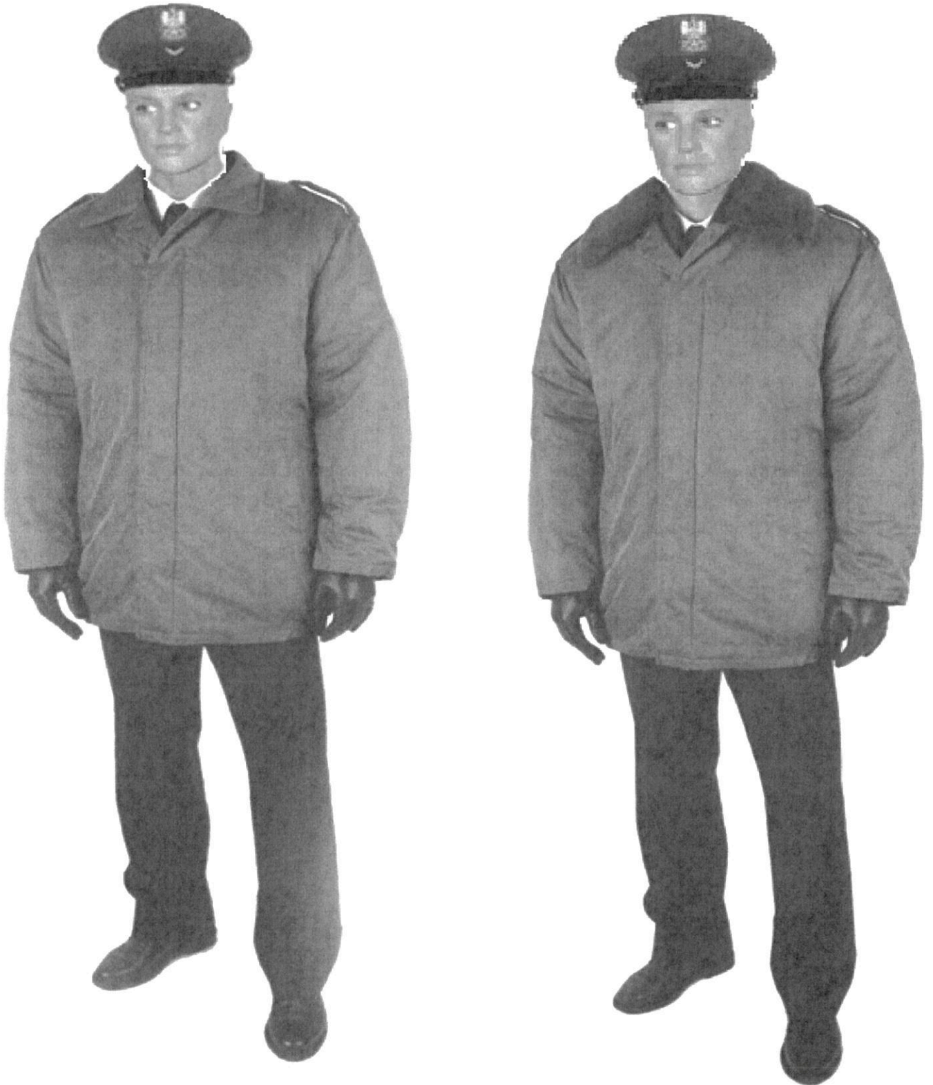
Ubiór policjanta w kurtce \frac{3}{4} z podpinką