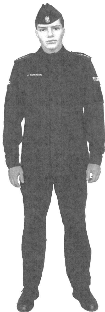
Ubiór policjanta w mundurze ćwiczebnym bez pasa głównego