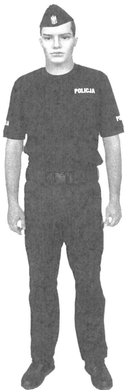
Ubiór policjanta w spodniach ćwiczebnych i koszulce z krótkim rękawem T-shirt