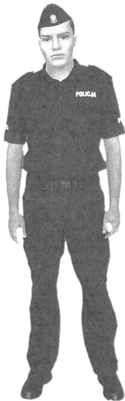
Ubiór policjanta w spodniach ćwiczebnych i koszulce polo z krótkim rękawem