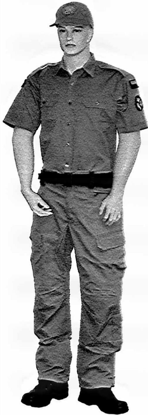
b) Ubiór polowy funkcjonariusza z koszulobluzą polową