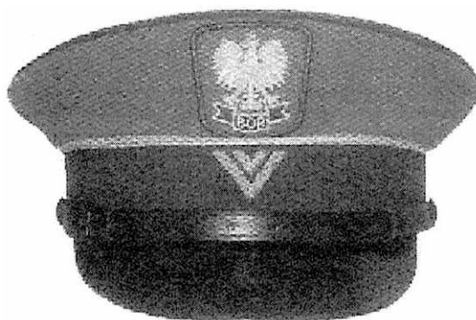
e) czapka wyjściowa podoficera w stopniu starszego sierżanta