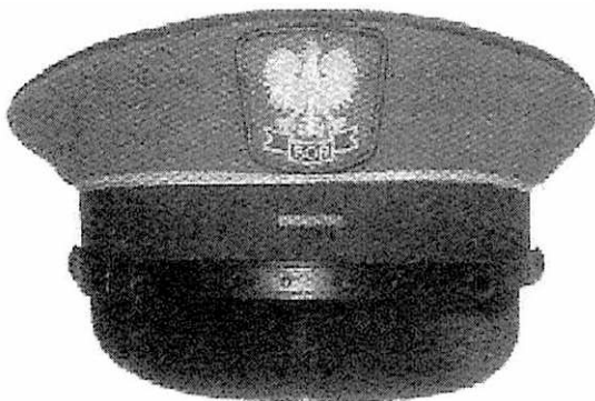
f) czapka wyjściowa szeregowego w stopniu starszego szeregowego