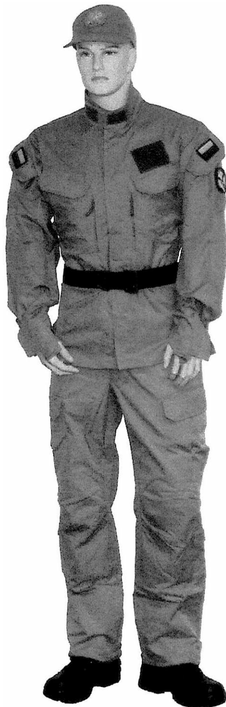
a) Ubiór polowy funkcjonariusza