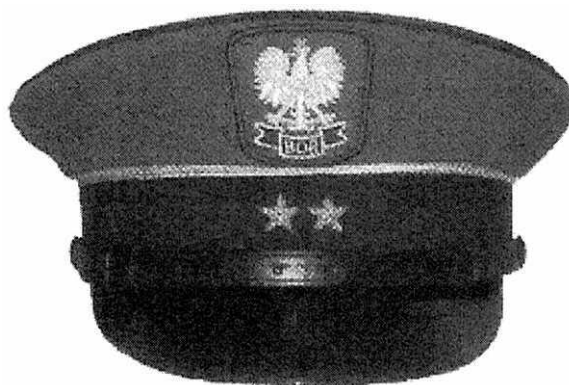
d) czapka wyjściowa chorążego w stopniu starszego chorążego