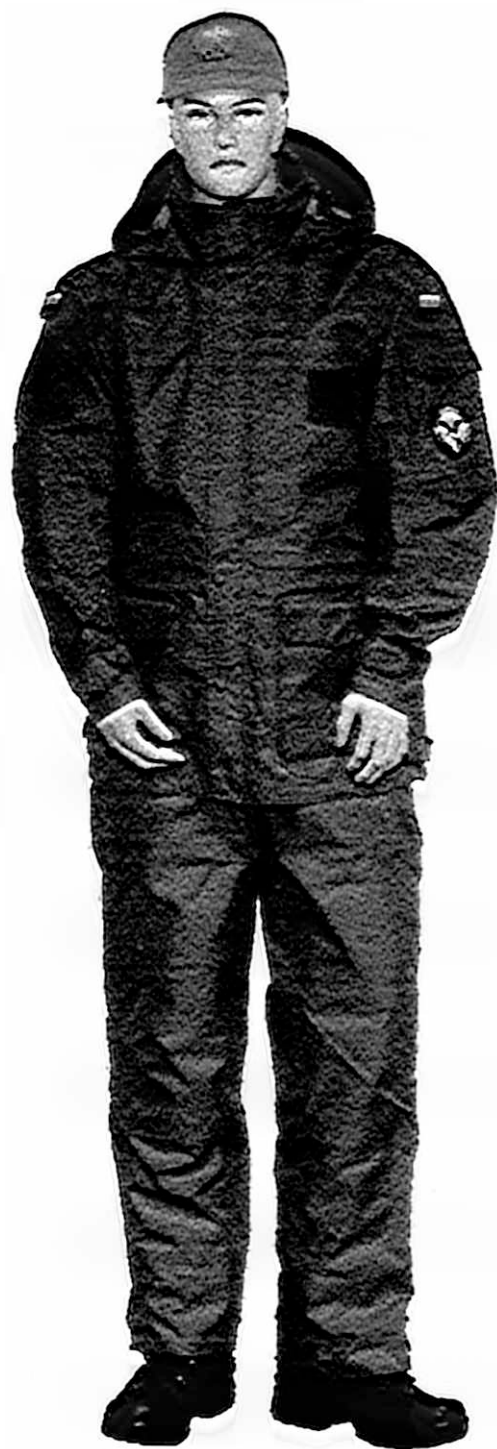
c) Ubiór polowy funkcjonariusza z kurtką i spodniami ubrania ochronnego