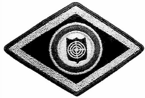
Oddział prewencji i pododdziały antyterrorystyczne