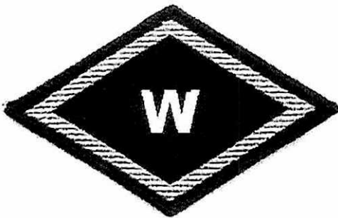
Służba spraw wewnętrznych