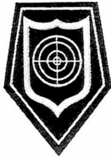
Oddziały prewencji i pododdziały antyterrorystyczne