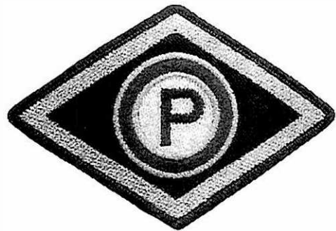
Służba prewencyjna (z wyłączeniem komórek organizacyjnych ruchu drogowego)