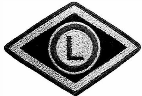
Służba wspomagająca. Wyższa Szkoła Policji w Szczytnie, szkoły policyjne i ośrodki szkolenia Policji