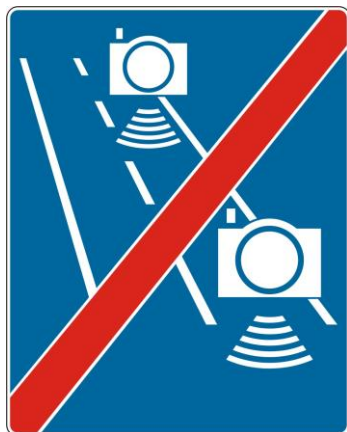
Rys. 5.2.56.3. Znak D-51b

Znak D-51b „koniec automatycznej kontroli średniej prędkości” (rys. 5.2.56.3) stosuje się w celu poinformowania kierujących pojazdami o końcu odcinka drogi, na którym średnia prędkość jazdy jest kontrolowana i rejestrowana przez urządzenia rejestrujące działające samoczynnie. Znak D-51b umieszcza się na końcu odcinka drogi objętego automatyczną kontrolą średniej prędkości, w przekroju poprzecznym drogi, w którym znajduje się urządzenie rejestrujące wyjazd z odcinka drogi objętego kontrolą średniej prędkości.