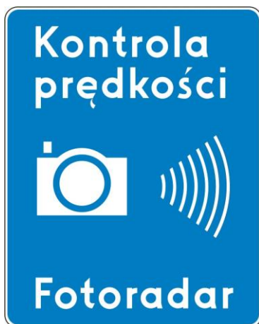
Rys. 5.2.56.1. Znak D-51

Znak D-51 umieszcza się przed stacjonarnym urządzeniem rejestrującym w odległości: